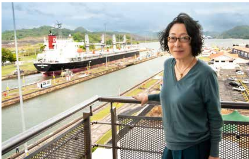
Mami Mizutori, representante especial del Secretario General de Naciones Unidas para la Reducción del Riesgo de Desastres (UNDRR) en el Centro de Visitantes de Miraflores.

Durante este periodo, se designa a un equipo de meteorólogos e hidrólogos para la vigilancia continua de las condiciones