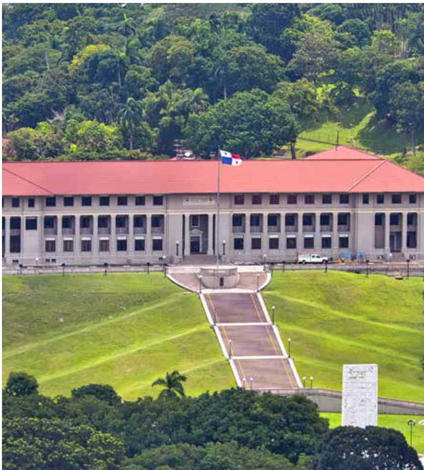
La placa en las escalinatas del Edificio de la Administración conmemora a los zoneítas que lucharon y murieron en la Primera Guerra Mundial.

La población civil de la Zona, mientras tanto, se volcó a apoyar a sus tropas luchando en el viejo mundo. Por ejemplo, las mujeres participaban en la compra de “Bonos de libertad” y “Sellos de ahorro de guerra” para ayudar a financiar las campañas militares.