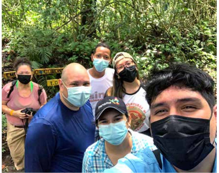
Miembros de la Fundación Micológica de Panamá

Los hongos se alimentan segregando unas enzimas digestivas y luego reabsorbiendo los nutrientes. En función de su papel ecológico y su forma de alimentarse, se clasifican de diferentes formas. Algunas especies son saprófitas y se alimentan de materia orgánica muerta. Otras viven en simbiosis y, al asociarse con ciertas algas, forman los líquenes, que provee carbohidratos y protección al hongo a cambio de agua y sales minerales.