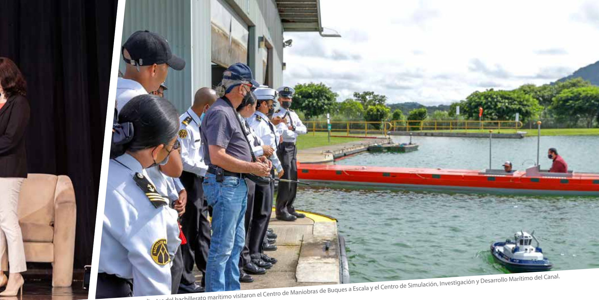
Unos 250 estudiantes del bachillerato marítimo visitaron el Centro de Maniobras de Buques a Escala y el Centro de Simulación, Investigación y Desarrollo Marítimo del Canal.