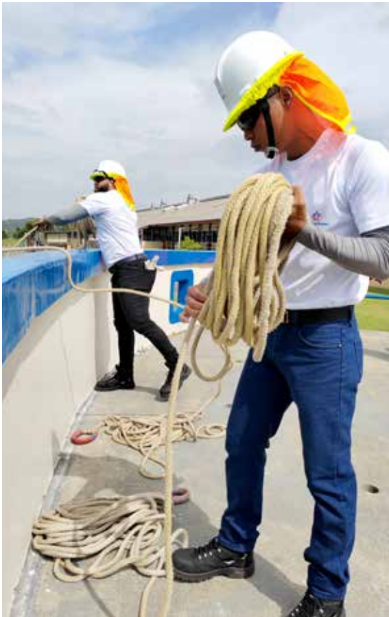
Práctica del tiro de ala.