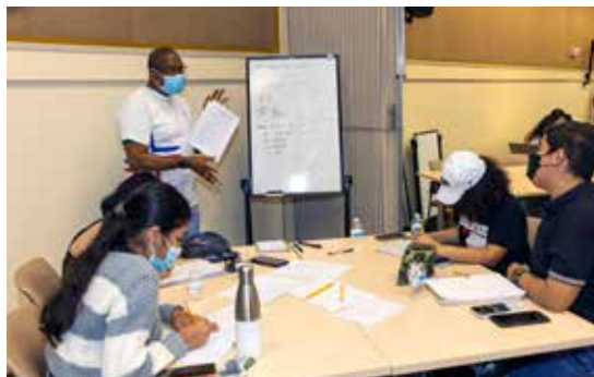
Pilando ando 2022.

Participaron los colegios Artes y Oficios Melchor Lasso de la Vega, Colegio Secundario Gatuncillo, Instituto de Formación Marítima Juan Sebastián Elcano y del Instituto John Dewey.