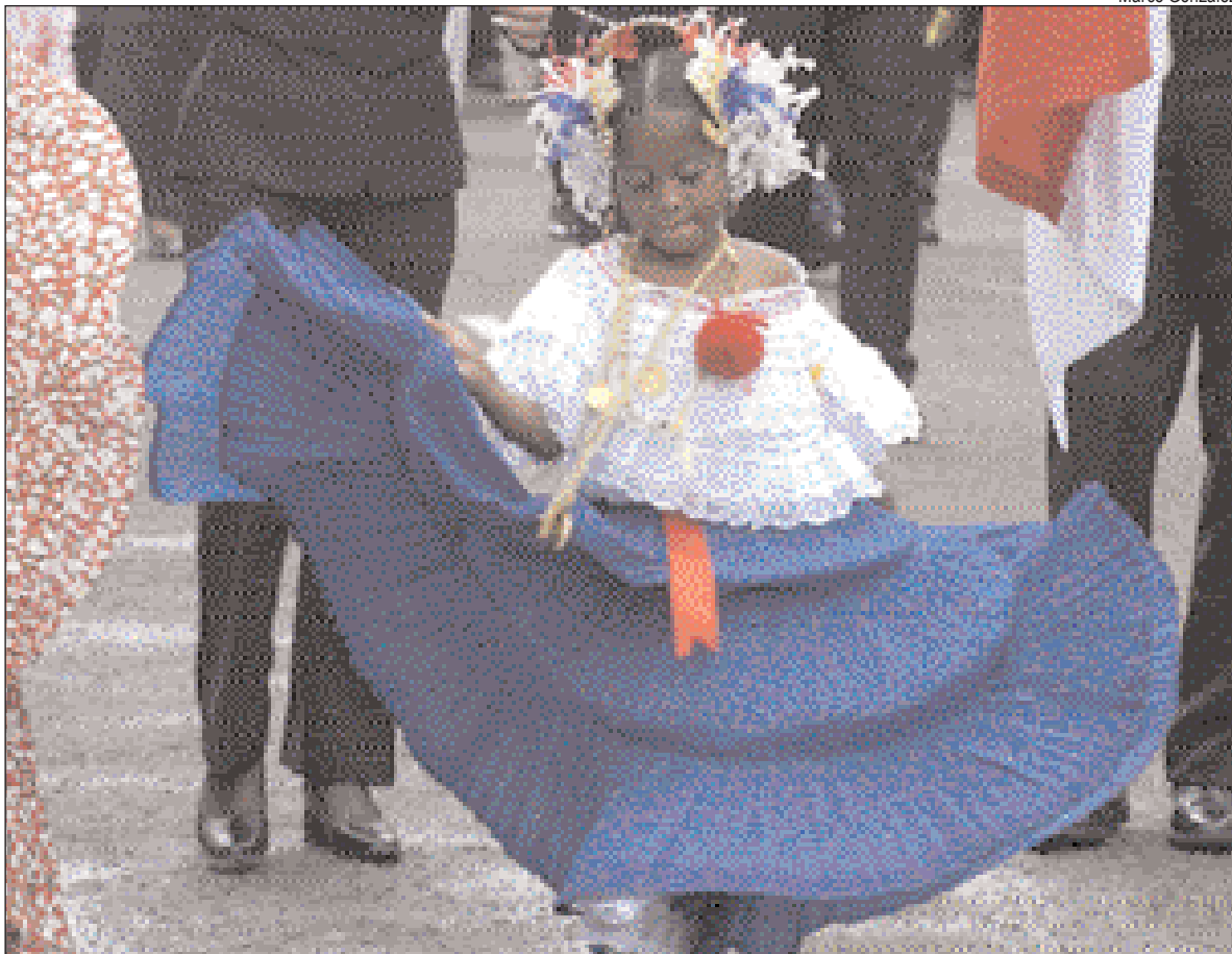
Una pequeña colonense pasea con orgullo el traje típico nacional durante el desfile del 5 de noviembre.