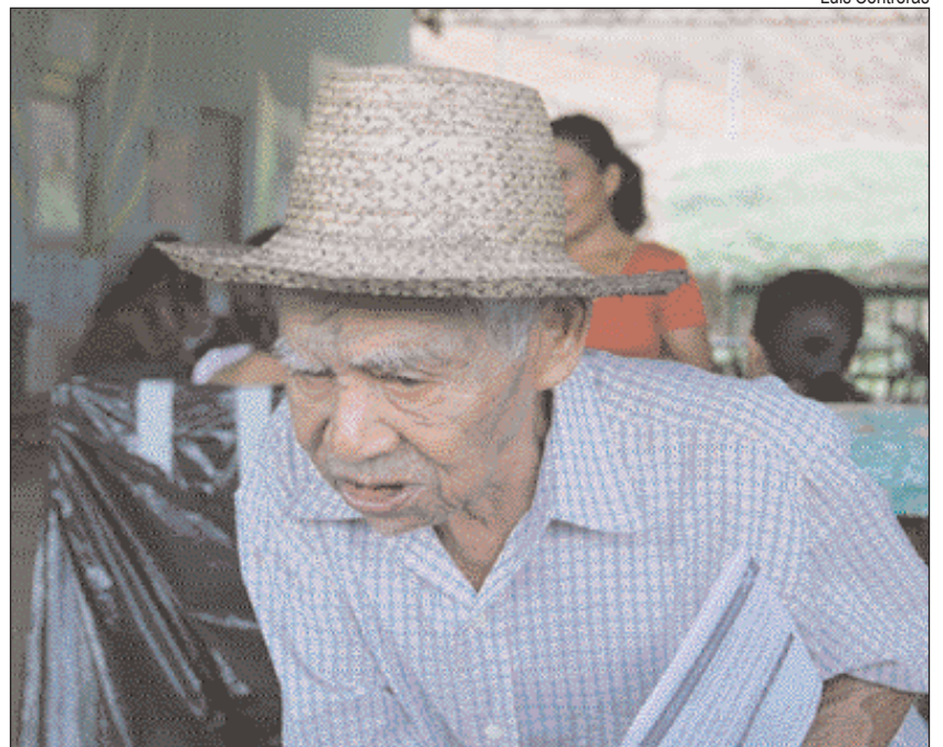
El programa de catastro y titulación de tierras en la región occidental lo ejecutan la Reforma Agraria y la Dirección de Catastro y Bienes Patrimoniales del Ministerio de Economía y Finanzas, con el apoyo financiero de la ACP que aporta más de 3 millones de dólares para hacerlo realidad.

“Esto se logra gracias al nuevo Canal; un Canal de todos los panameños, administrado por panameños y cuyo norte más importante es lograr el bienestar de todos los panameños”.