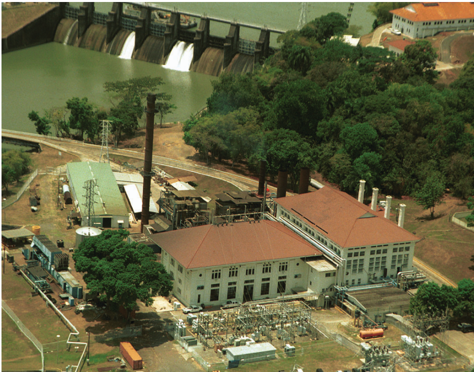
Planta generadora de Miraflores

La Ley orgánica de la ACP establece que tiene que operar de una manera eficiente y rentable. Es decir, debe tener una rentabilidad que permita la recuperación de sus costos de capital, y los costos de administración, operación y mantenimiento de sus activos, deben ser eficientes. Cuando la ACP calcula los precios que va a ofrecer al mercado eléctrico por sus excedentes, considera la recuperación de todos estos costos incluyendo una tasa de rentabilidad que le permita recobrar sus costos de capital.