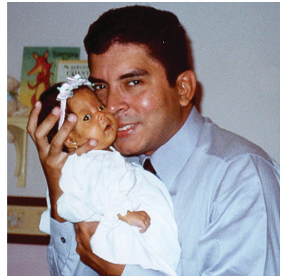
Amor de padre