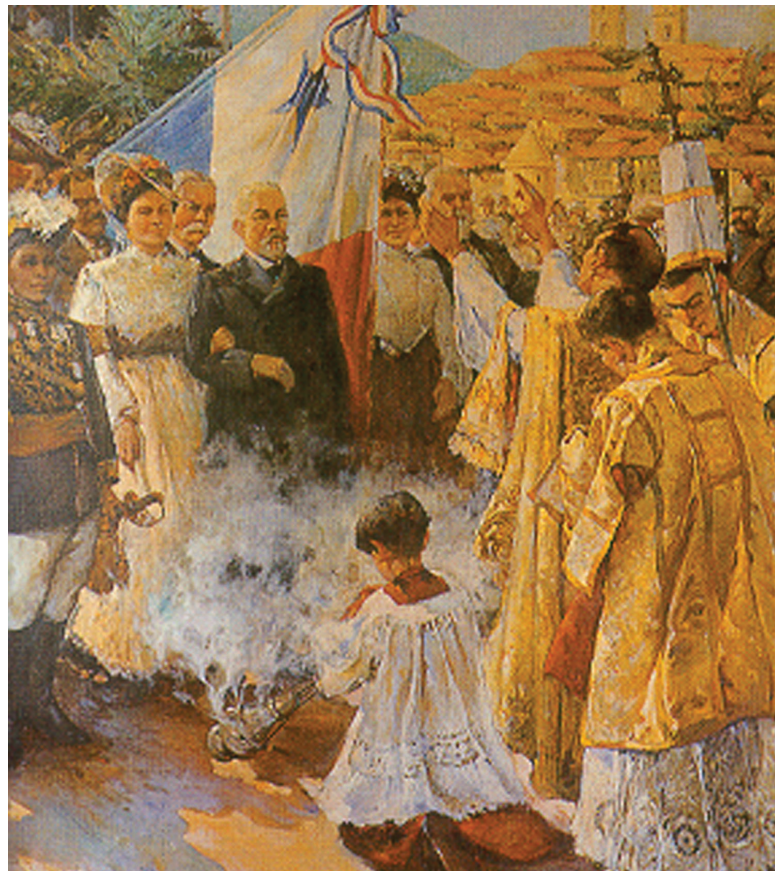
Bautizo de la Bandera Óleo sobre tela del pintor panameño Humberto Ivaldi, pintado en 1943.

Varilla. Aunque el gobierno colombiano intentó a posteriori ratificar el Tratado Herrán – Hay si Estados Unidos le garantizaba su soberanía sobre el Istmo, ya era demasiado tarde. Colombia no era necesaria para negociar el tratado del Canal porque Panamá había decidido seguir su