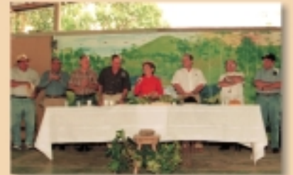
Coclesito, marzo de 2001

La ACP ha impulsado los llamados a diálogo de la Señora Presidenta y la Iglesia Católica.