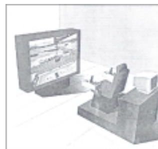
Simulador de grúas