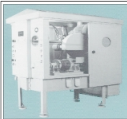
Procesador de muestras y especímenes

Finalmente, el Ing. Alemán se pronunció sobre la importancia que tienen la capacitación y el desarrollo del recurso humano en la empresa canalera: “La gran base y la fortaleza más importante de esta empresa es su recurso humano y seguiremos invirtiendo para beneficio de ustedes, de nosotros; de esta empresa y, sobre todo, de nuestro país”.