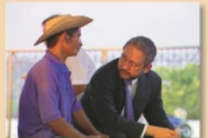
Estudios de Rhoñones, marzo de 2001

Paralelamente FETV y Canal 11 emiten semanalmente "El Canal al Día", con información sobre la Cuenca y la modernización del Canal.