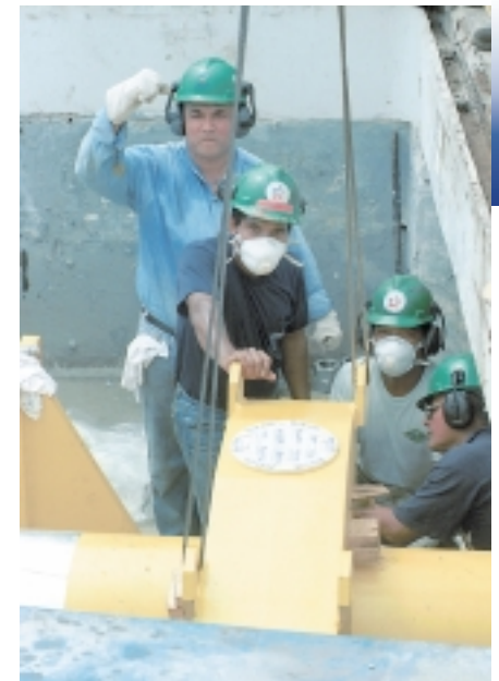
Sistema hidráulico Instalación de sistema hidráulico que reemplaza el sistema electromecánico.