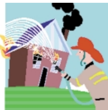
La División de Administración de Emergencias y Contingencias está organizando la Semana de Prevención de Incendios del 7 al 13 de octubre del 2001.

Si piensa que necesita de seguridad adicional, las verjas deberán ser instaladas de forma que puedan abrirse fácilmente desde adentro. Las rutas de escape no deben requerir de equipo especial para su utilización.