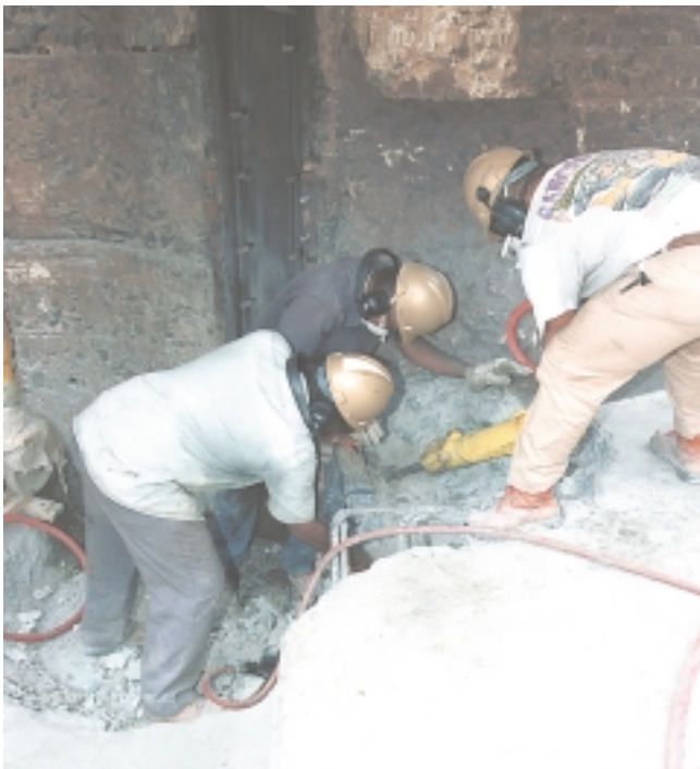
Fundición K Demolición para sacar la fundición K a ambos lados de la cámara.