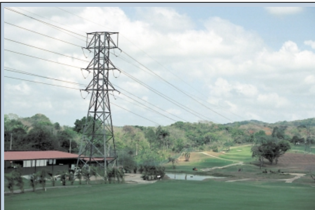
Torre de transmisión en campo de golf de Summit

En la ACP, el programa de antivirus es manejado y administrado por el Departamento de Informática y Tecnología, a través de la Oficina de Seguridad de Sistemas de Informática. Si desea mayor información acerca de la detección, prevención y protección contra virus, puede referirse al Intranet, en http://infored.acp/im/imxi/index.html .