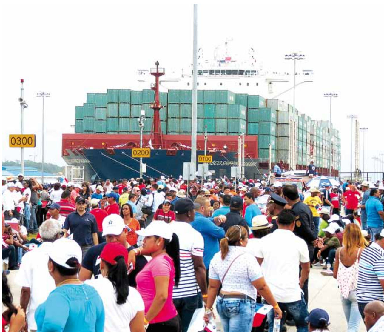
Inauguración del Canal ampliado.

En el caso de Corozal, es una idea que apareció entre 2003 y 2004, que no se concretó y que cobra más valor hoy día ante las exigencias del mercado marítimo.