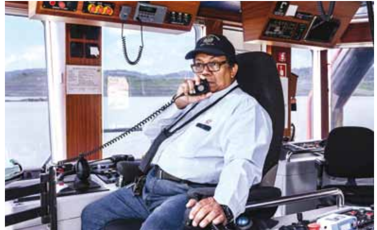
Viluce en plena faena en el remolcador Cerro Santiago.

Como alguien feliz y con una actitud altamente positiva. No tengo tiempo para malos momentos. Por política personal, saco provecho de situaciones negativas a positivas. Eso lo viví cuando me detectaron cáncer de colon, ya que luego de que el doctor me explicara la operación que me tenía que hacer le dije: “No se preocupe, vamos a comprar