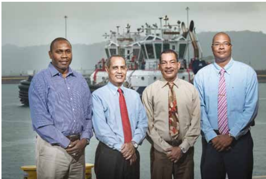
Capitanes de remolcador - Atlántico.

Se contrataron empresas, se coordinó a proveedores, se instaló equipo técnico para las transmisiones vía satélite y en directo, se hizo mucho trabajo de voluntariado para atender a los miles de invitados, etc. Mencionar los nombres de cada uno en este artículo sería imposible, pero se formaron comisiones que integraron cada equipo y que hicieron un gran trabajo para la inauguración del Canal ampliado, entre ellas: marca, contratos, mantenimiento, ingeniería, seguridad, producción de TV, traducción simultánea, mercadeo, telecomunicaciones, fotografía y contenido, redes sociales y App, acreditaciones, comunicación interna, comunicación internacional, comunicación nacional, documentación histórica, protocolo, rutas y transporte, voluntarios, voceros y operaciones.