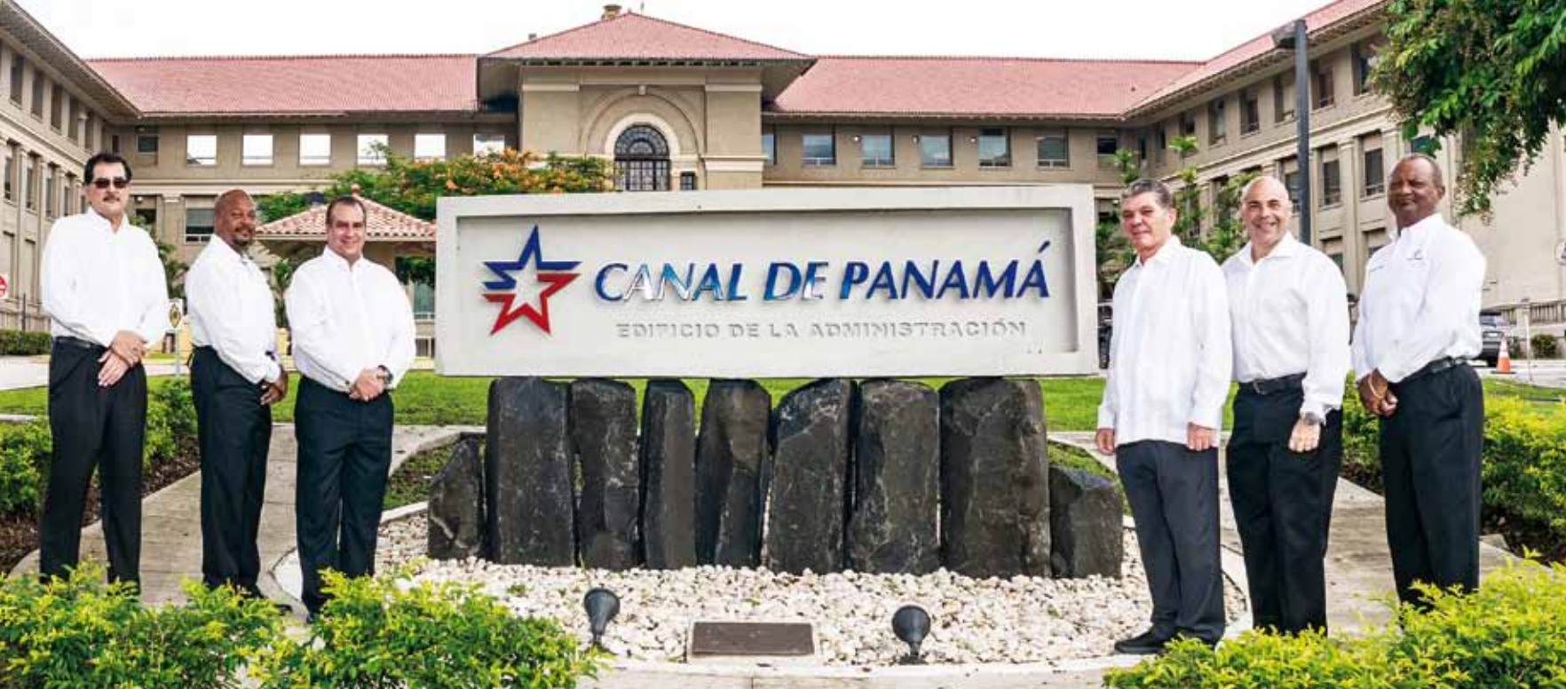
Grupo de prácticos.