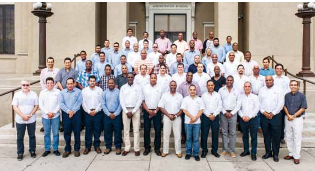
Grupo de operaciones de esclusas.