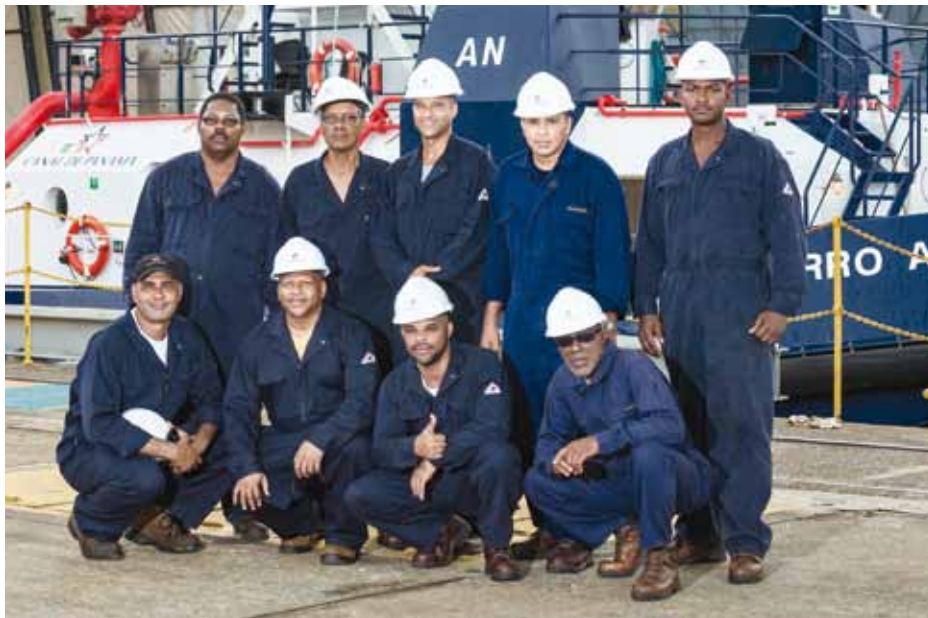
Sección de mantenimiento preventivo y apoyo de operaciones.