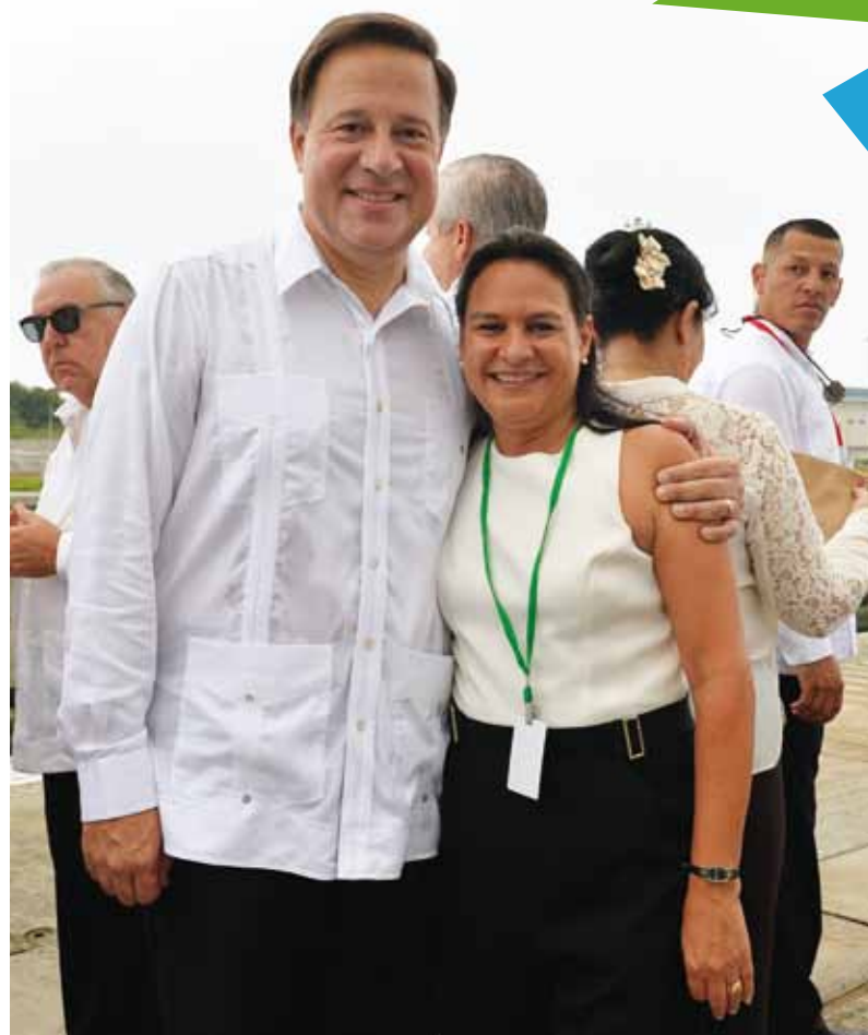
La ingeniera Marotta junto al presidente de la República, Juan Carlos Varela.

IEM.- Lo menos bueno después de la inauguración, lo más triste para mí es que dentro de tres meses muchos colaboradores de este gran esfuerzo dejarán la Vicepresidencia de Ingeniería. Algunos están en otras vicepresidencias dentro del Canal, otros tendrán que buscar futuro en otras entidades nacionales o internacionales, si se da el caso. He tenido que firmar unas 100 cartas a colaboradores temporales anunciándoles que esto termina; otros cientos de cartas para los que se van a otras oficinas dentro de la ACP. Pienso que esa es la parte más triste de todas. Gracias a Dios hemos tenido solicitudes del aeropuerto (Tocumen, S.A.), del Metro de Panamá y del cuarto puente sobre el Canal, de talentos que salen de aquí para ser contratados allá. Varios se fueron antes de concluir el contrato con el Canal, porque debieron aprovechar que se les abrió otra oportunidad afuera para utilizar el conocimiento que han tenido aquí, y otros se han ido a distintas empresas.