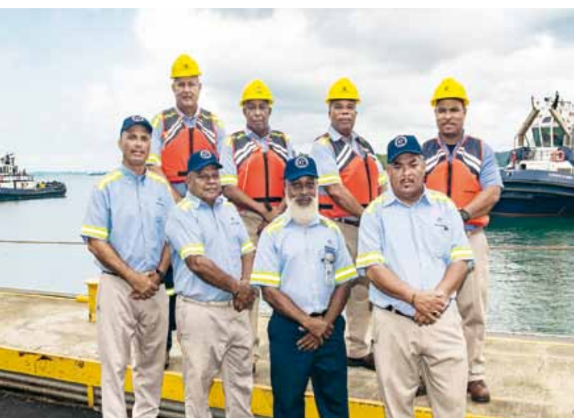
Transporte marítimo y asistencia de cubierta - Atlántico