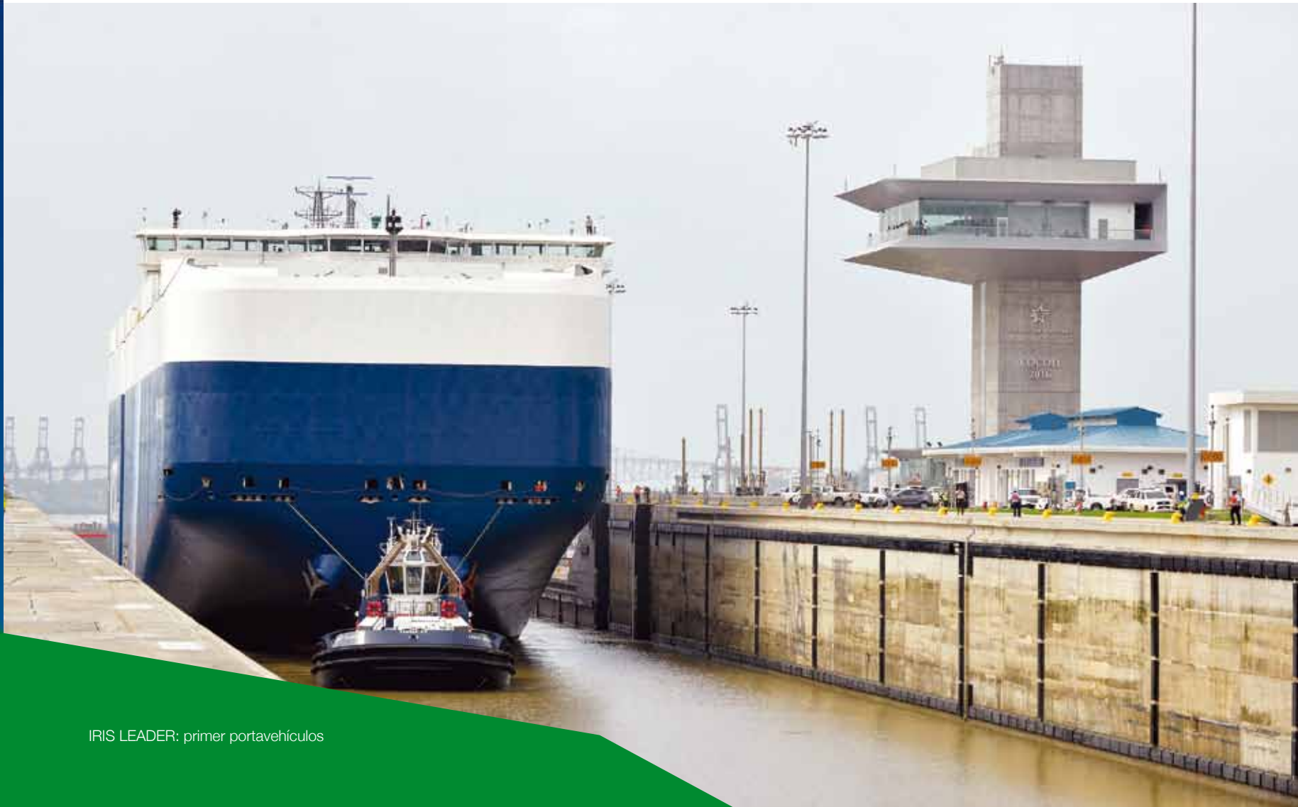
IRIS LEADER: primer portavehículos