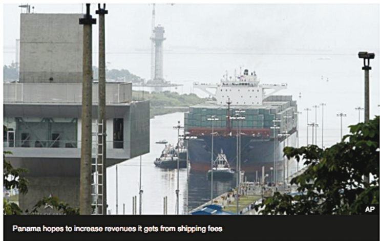
A giant Chinese container ship has become the first vessel to move from the Atlantic to the Pacific Ocean via the newly-enlarged Panama Canal.

The ship was greeted with fireworks and cheers from a crowd that had gathered at the Cocoli locks to celebrate.