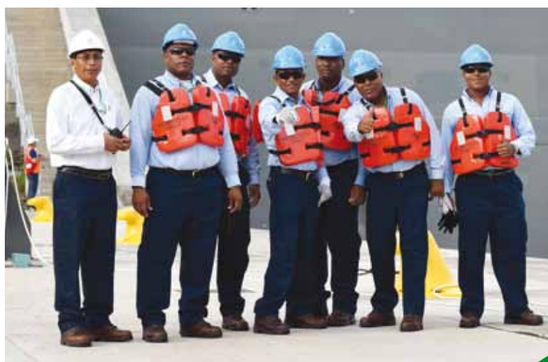
Listos para el trabajo.