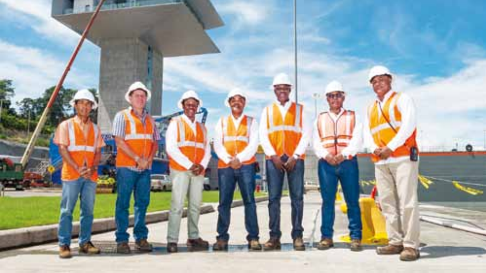
Personal del Atlántico.

Pero no se trataba solo de montar una tarima; hubo gente que se encargó de tareas tan variadas que iban desde la construcción de las escaleras de cemento que daban acceso al área del público, hasta la instalación de banderines y banderas a lo largo de todas las esclusas.