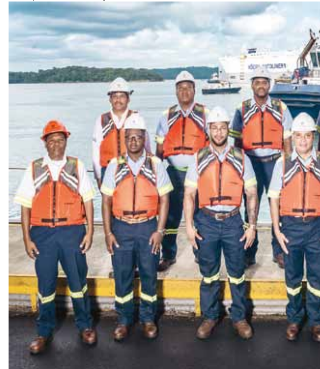
Transporte marítimo y asistencia de cubierta - Atlántico