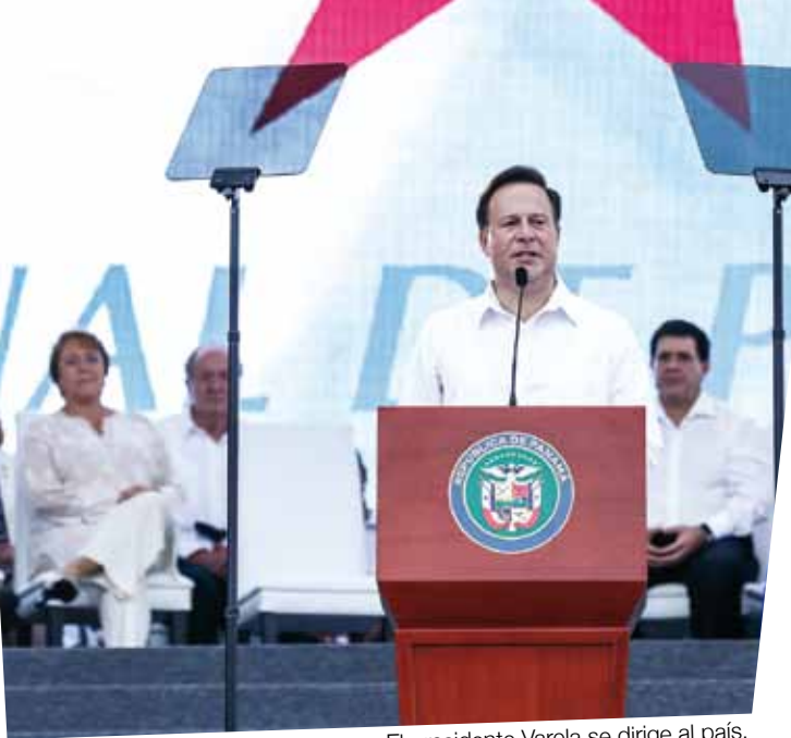
El presidente Varela se dirige al país.