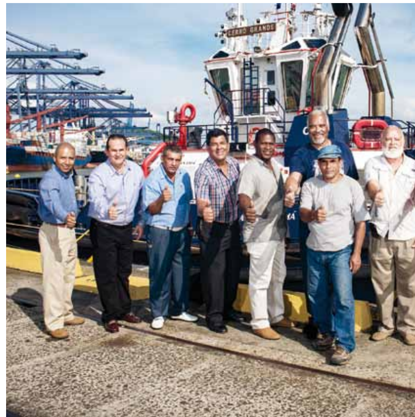
División de Mantenimiento.

Unos mil 500 colaboradores del Canal de Panamá dedicaron días y noches en pensar, contratar, invitar, organizar, coordinar y armar todo lo que se requería para la inauguración.