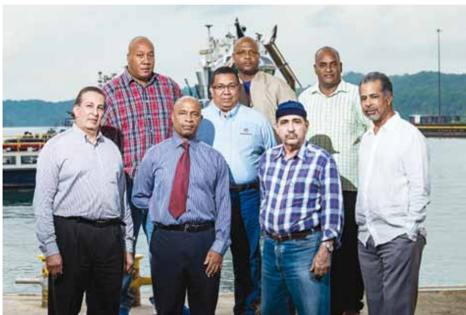
Tripulación del remolcador Gatún.

Este engranaje, que llevó miles de horas de trabajo y mucha dedicación, dio como resultado una fiesta que elevó el orgullo y el nacionalismo panameño al máximo.