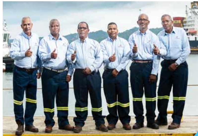
Grupo Emergencias y Contingencias.