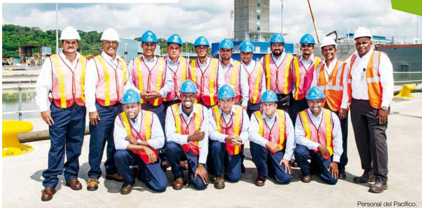
Personal del Pacífico.