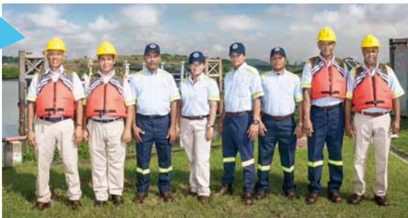
Operaciones de lanchas y auxiliares de cubierta del Pacífico.

Se dice fácil, pero fueron cerca de 12 mil 960 horas dedicadas a trabajar, pensar, organizar, crear equipos de trabajo, prácticamente “desayunar y almorzar inauguración de la ampliación”. Algunos decían que debía celebrarse con un gran concierto gratuito para todos los panameños, otros preferían una ceremonia que incluyera el paso de un barco, como se hizo con el vapor Ancón. En fin, las opiniones eran variadas.