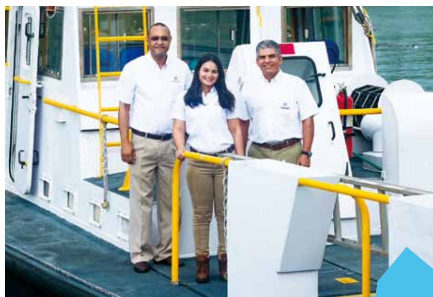
Inspectores de buques.