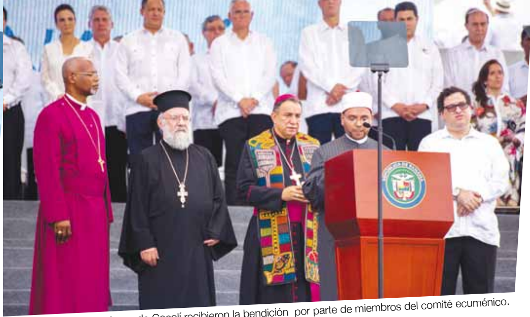
Las esclusas de Cocolí recibieron la bendición por parte de miembros del comité ecuménico.

Cerca de las 3:00 p.m. el enorme gigante de mar hizo su entrada a la cámara alta y los gritos de fervor patriótico no se hicieron esperar, la gente ondeando sus banderas, aplausos, manos arriba, gritos y más gritos. El capitán de la gran nave sonaba la bocina y se escuchaba cómo resonaba y así mismo volvía la gente a gritar.