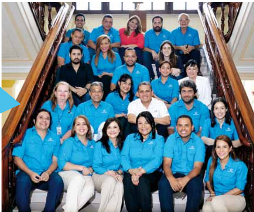
Equipo de Comunicación Corporativa responsable de la organización, cobertura y realización del evento de inauguración, así como la acreditación y atención de más de mil periodistas nacionales y extranjeros.