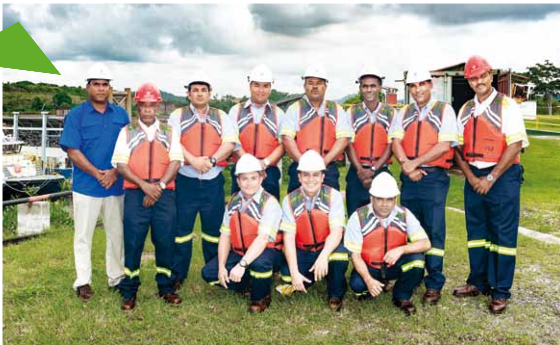
Transporte marítimo y asistencia de cubierta - Pacífico.