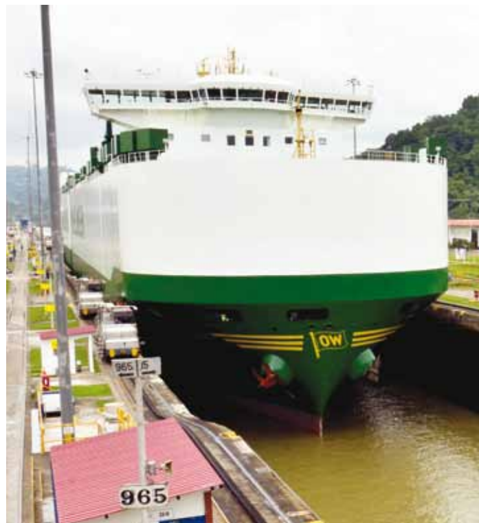
Actualmente, solo los buques portavehículos con dimensiones panamax pueden navegar por el Canal panameño.

Los ejecutivos del Canal se han reunido con los representantes de la industria de portavehículos y RORO, agrupados en el denominado Pure Car Carrier Ad Hoc Group, para discutir la estructura de peajes que se implementará con el Canal ampliado. Esta nueva estructura considera los efectos que la estrategia de producción local para consumo interno tendrá en los navieros y, en especial, la necesidad en rutas emergentes de transportar mercadería en volúmenes inferiores a los estándares de mercado.