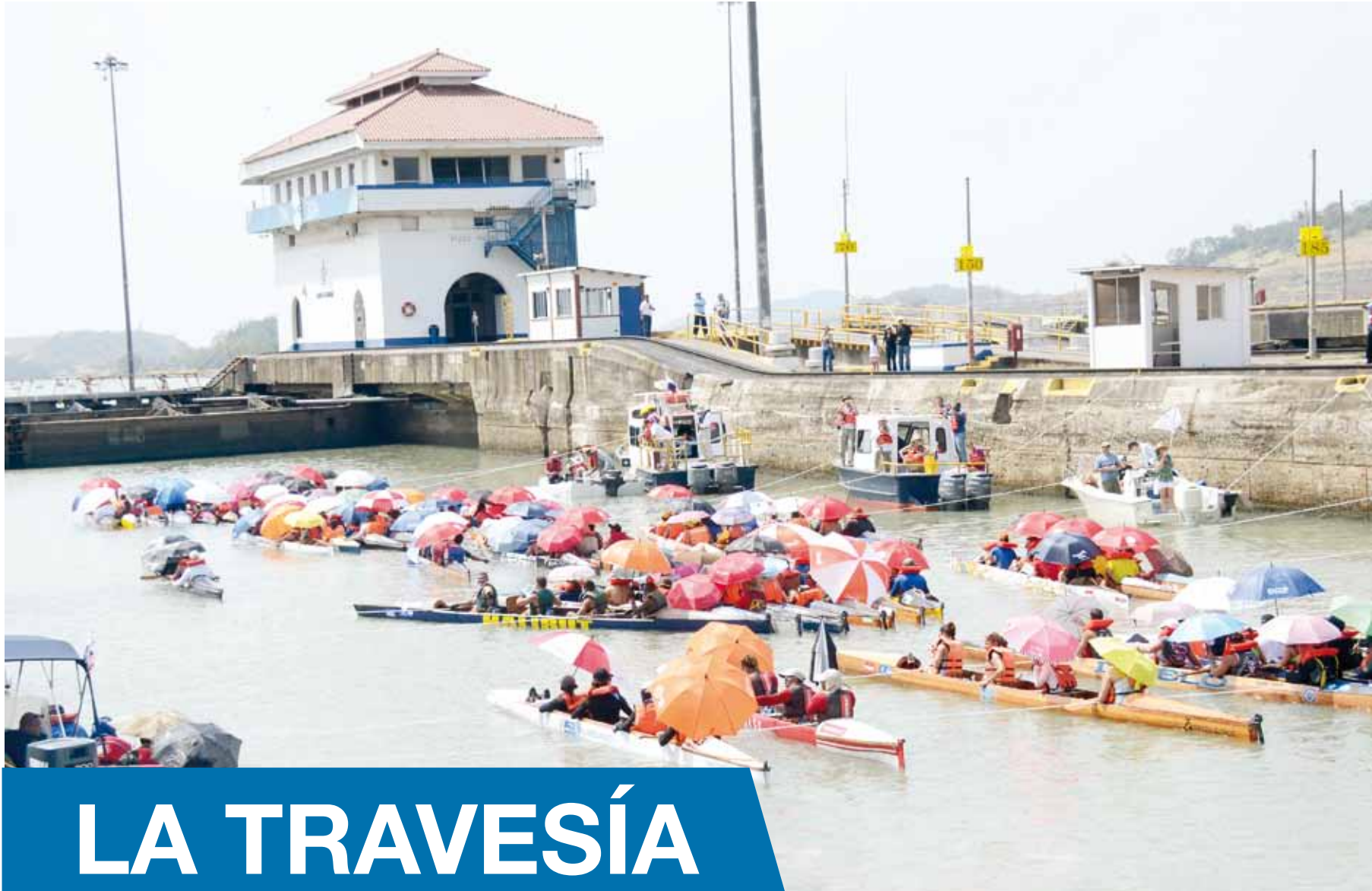
Esperando el esclusaje.