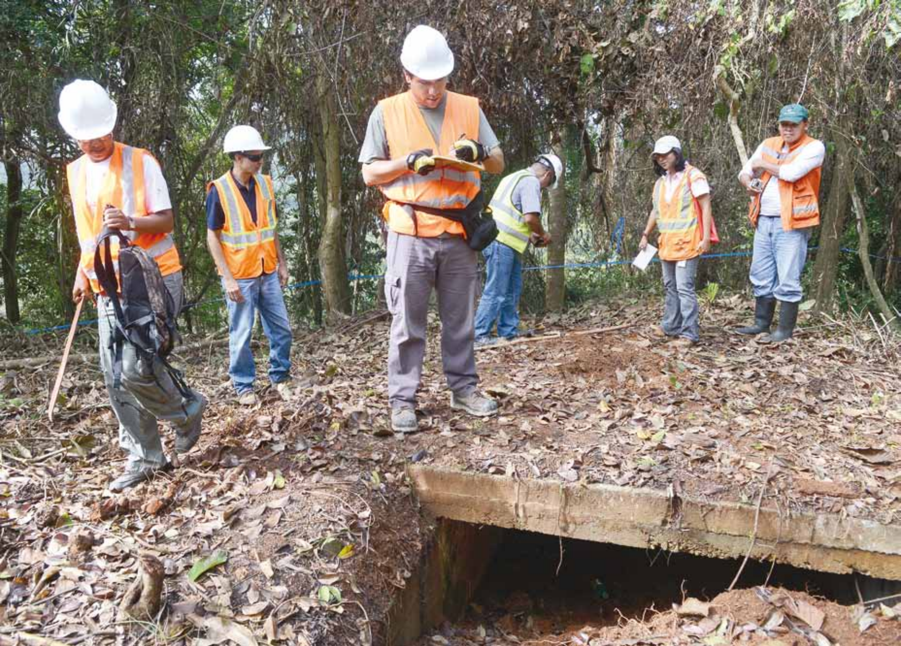
El equipo lleva a cabo un reconocimiento en el área del búnker recién descubierto.

Entra en escena la empresa subcontratista Isthmian Explosive Disposal (IED), la misma que ha saneado más de 500 hectáreas de polígonos de tiro en la ampliación desde el año 2007. Por los dos meses que sus trabajadores estuvieron asignados a la limpieza del cerro Miraflores 2, cumplieron con el protocolo de reportar cualquier hallazgo arqueológico para su evaluación. Muchos de ellos, antiguos miembros de los estamentos militares panameños, conocen la zona porque es la misma en la que, décadas atrás, realizaron ejercicios en conjunto con Estados Unidos.