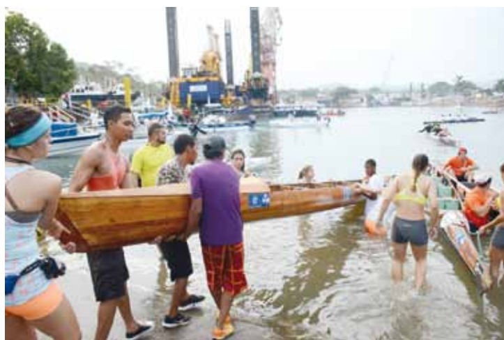
Preparándose para competir.

El atractivo de cruzar las esclusas del Canal de Panamá en su centenario despertó el interés internacional, al punto que llegaron 15 equipos de Brasil, España y Estados