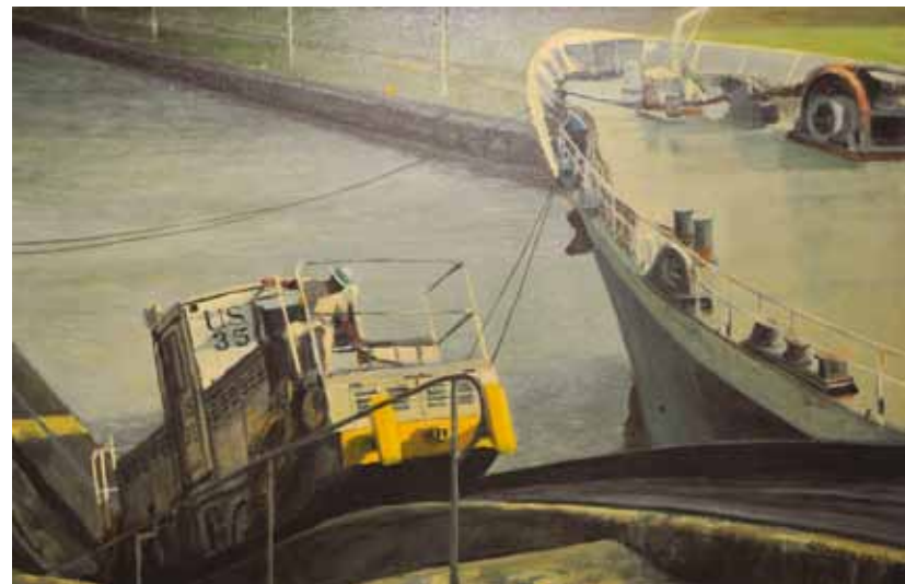
Pintura de las esclusas del Canal.