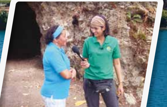
Conoce los secretos de las cuevas de Chilibre