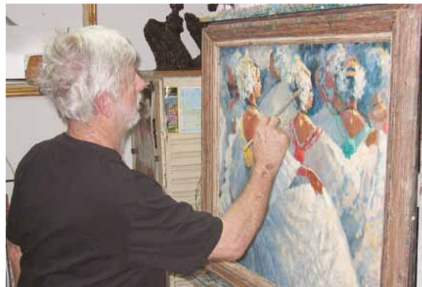
Una de las grandes fascinaciones del artista es pintar mujeres panameñas con su traje típico, la pollera.