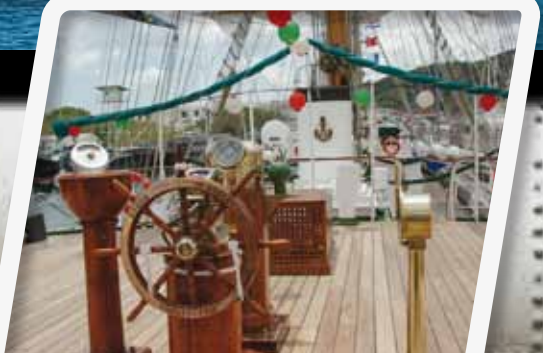
Vive la emoción de los veleros