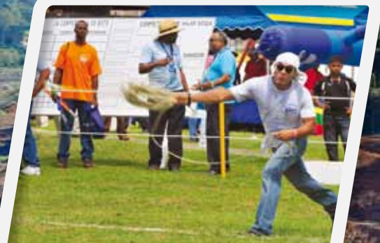
Tiro de Línea: pasión por el trabajo