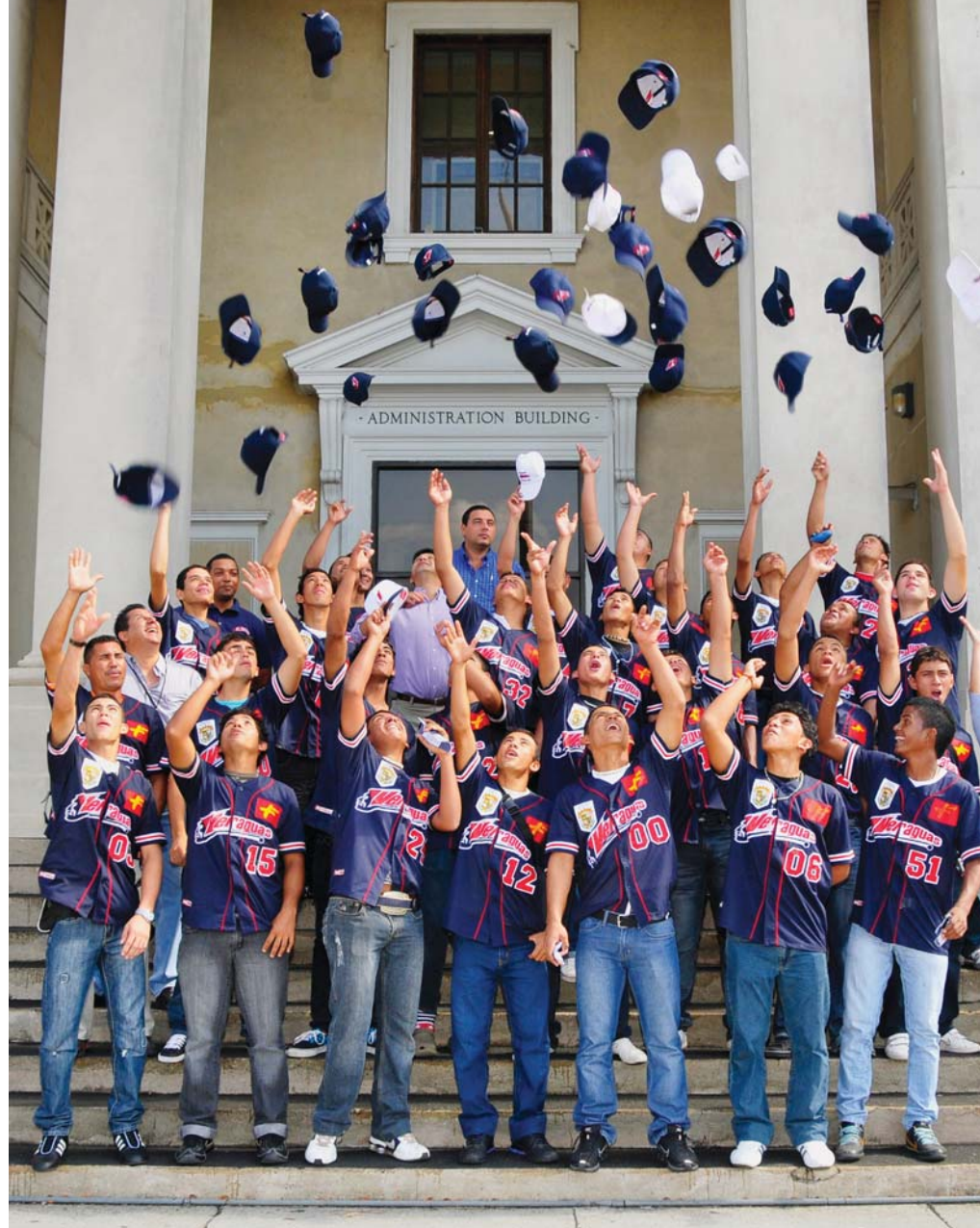
Los campeones del béisbol juvenil disfrutaron su visita al Canal de Panamá.

“Viendo Discovery Channel y otros canales que pasan reportajes sobre el Canal, de inmediato me tracé una meta: venir y vivir esta experiencia”, dijo emocionado cual si reviviera ese memorable quinto partido de la Serie Mundial de 2000, cuando en la “Serie del Subway”, en el noveno