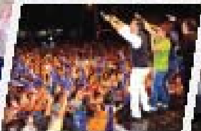
El Mesaje Cultural ACP Danza al Interoeste