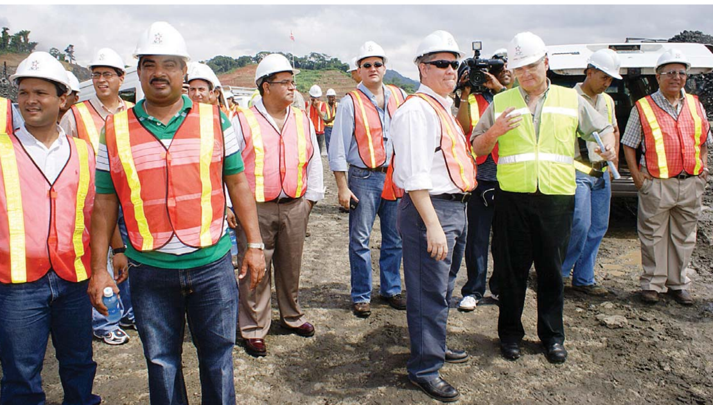
Los diputados de la Comisión de Asuntos del Canal fueron informados de los avances de la ampliación durante un reciente recorrido por los sitios de construcción.

Una comisión de la Asamblea Nacional de Diputados está dedicada a darle seguimiento a los temas de la vía interoceánica, y de esta manera contribuye a que el Canal siga siendo motivo de orgullo de los panameños.