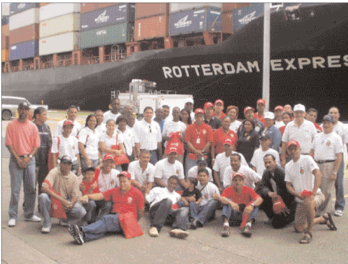
Personal del Cuerpo de Bomberos de Panamá, Colón y Bocas del Toro visitó las esclusas de Gatún como parte del II Convivio Nacional de Clases - Bomberos, realizado en la ciudad de Colón en el mes de junio.