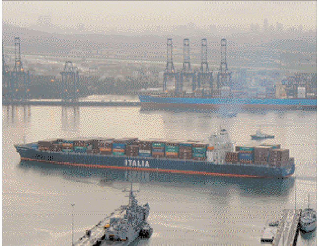
Un panamax transita al amanecer frente al puerto de Balboa.