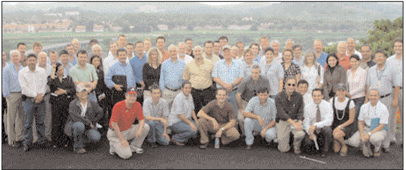
programa de ampliación del Canal.

Tras recibir la aprobación de su Junta Directiva, la ACP emitió el pasado 1 de junio la licitación para contratar una empresa que apoyará a la ACP en la administración del